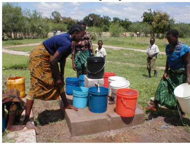
Finalmente l'acqua torna a scorrere