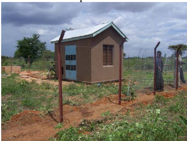
La nuova recinzione per la centrale di pompaggio