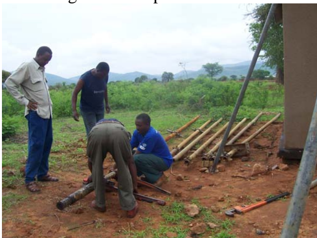
Riabilitazione del pozzo