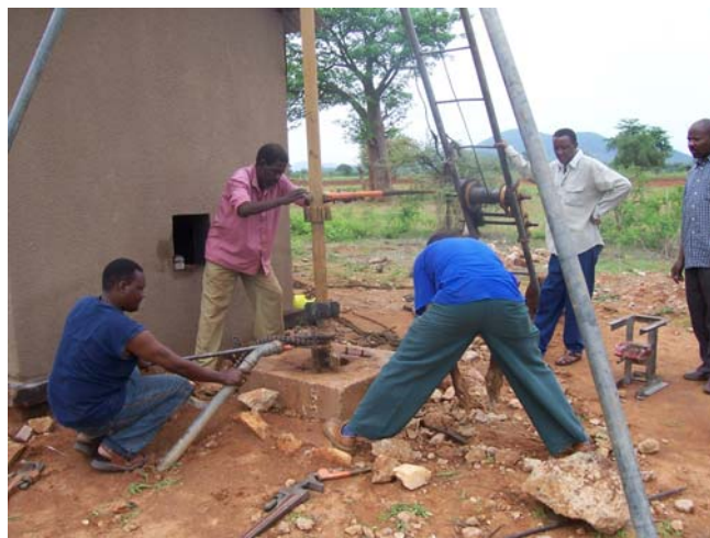
Posizionamento della pompa